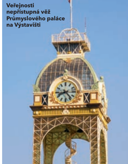
Veřejnosti nepřístupná věž Průmyslového paláce na Výstavišti