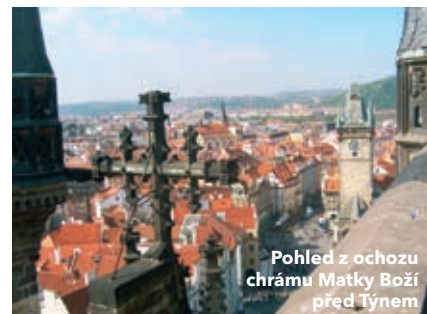
Pohled z ochozu chrámu Matky Boží před Týnem