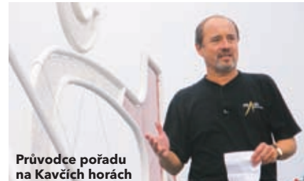
Průvodce pořadu na Kavčích horách